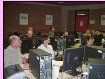
Enkele aandachtige deelnemers aan sessie 2

weet organiseren wij volgend jaar ook nog aanvullende 'vervolmakingssessies'?